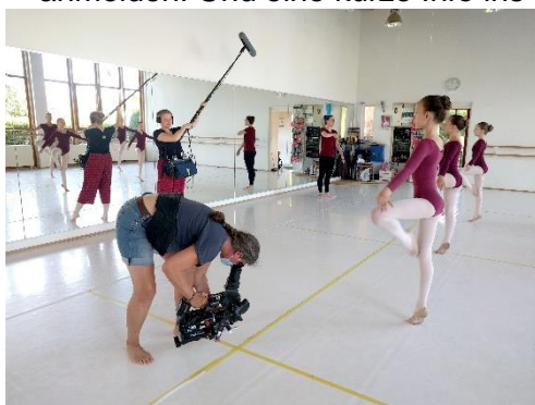
Kinder der Ballettschule in einer Produktion für einen Tanz mit der Maus gefilmt.